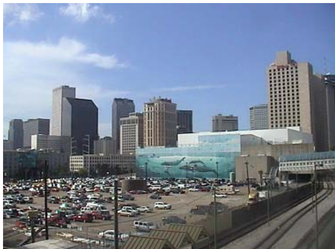
New Orleans-i felhőkarcolók

szigorú diétája jelentősen javítja a túlélést azon betegekkel szemben, akik nem vettek részt rendszeres tanácsadásban és nem figyeltek különösen az étkezésükre. Az is kiderült a vizsgálatból, hogy nem volt különbség az amerikai szigorú diéta és a mediterrán diéta hatékonysága között. A mostani találkozón is bemutattak több olyan vizsgálatot, amelyekben a koleszterinszintet csökkentő gyógyszeres kezelés jelentőségét hangsúlyozták.