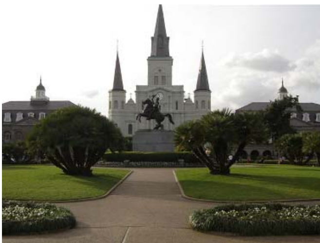
Jackson admirális szobra a róla elnevezett téren

ponttal és szállodai kapacitással rendelkeznek. Így általában 6-7 város ad helyet ezeknek a találkozóknak. Az American College of Cardiology (ACC) 2007. évi tudományos kongresszusát New Orleansban tartották március 24 és 27 között. Ez az időpont