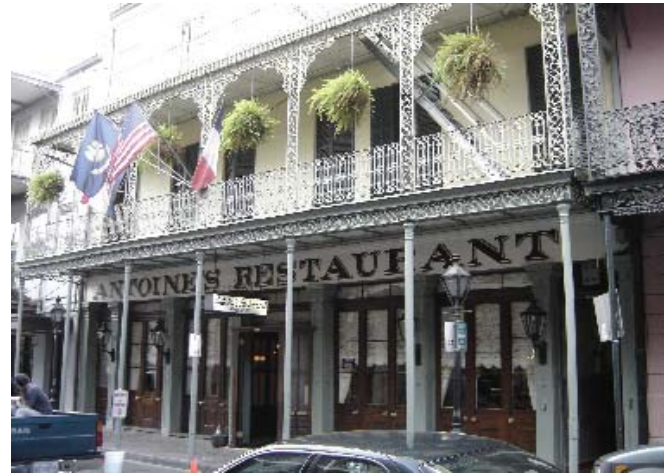
A Francia negyedben

a 2005. szeptemberi hurrikán előtt ki volt tűzve, és az egy hétig tartó áradás és pusztítás utáni időszakban egy ideig még kérdéses volt, hogy meg lehet-e rendezni ezt a nagy próbatételt jelentő eseményt. A kongresszuson fényképeken mutatták be a közel 2 ezer ember halálát okozó áradást. Akkor a szűkebb New Orleans 1,2 millió lakosa elköltözött, illetve elmenekült, és még most, másfél évvel a katasztrófa után is több százezer azoknak a száma, akik nem költöztek vissza. Mindenesetre a belvárosban, a felhőkarcolók állapotán és a híres francia negyed vendéglőin nyoma sem volt a hurrikánnak. Alaposabban megfigyelve azonban lehetett látni, főleg a szűkebb belvárosban kívül, a pusztítás nyomait.